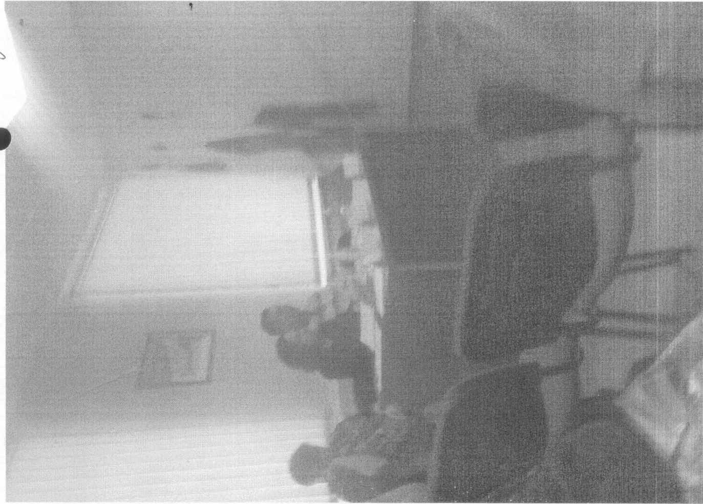
Отчет нежа.нассасемен (ЗУМ) Лубини А.М.